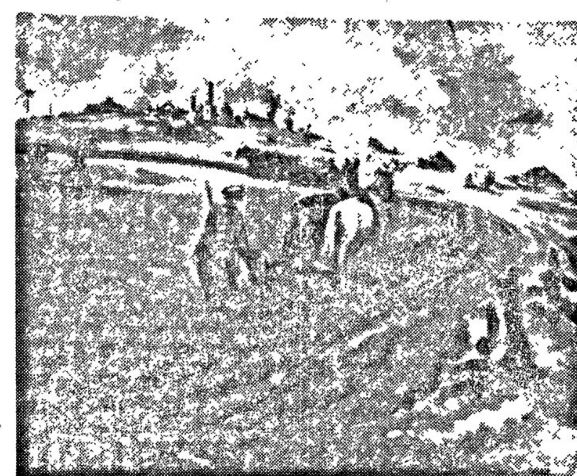
«На земле освобожденной». Картина У. ТАНЫКБАЕВА (Узбекистан).