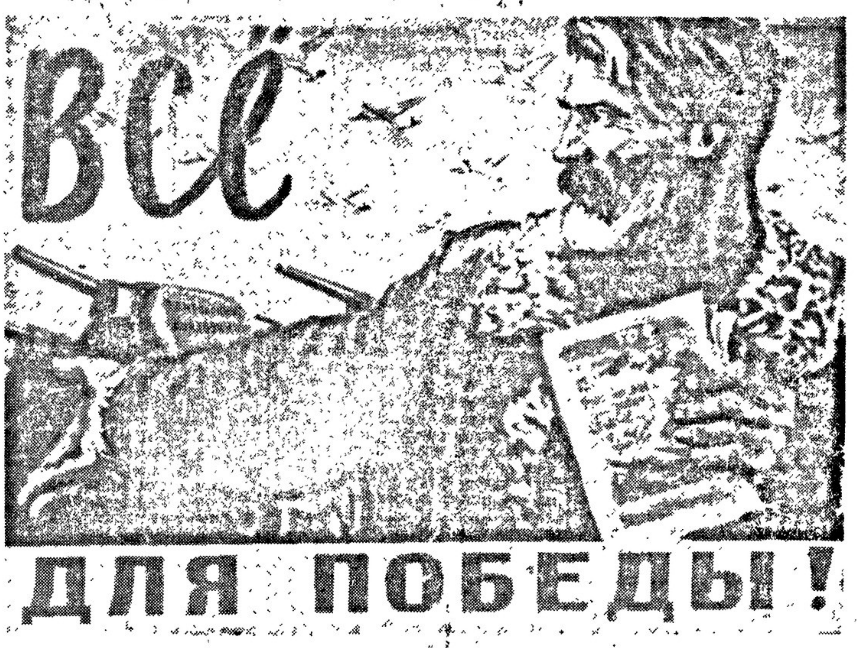
Рисунок Д. ШМАРИНОВА.

Недостаточный уровень мастерства и другие слабости изобразительного искусства некоторые обвиняют лишь известным перерывом в развитии традиций русской реалистической школы, связанным с рецидивами формализма. До сих пор, мол, сказываются результаты формалистических болезней, до сих пор приходится перечувствовать ряду художников, и только теперь мы подошли к тому периоду развития, когда изобразительное искусство может поставить перед собой большие задачи полноценного реалистического творчества.